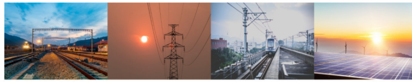
铁路产品 铁塔产品 轨道产品 光伏产品

最后，公司董事长洪敏认真听取汇报，对2023年取得成绩，高度点赞，同时，针对2024年目标提出了四点要求：一要以结果为导向细化实施、闭环落实；二要以效益为导向求真务实、提能增效；三要以问题为导向敢作善为、攻坚突破；四要以共赢为导向党建统领、再创新辉煌。并表示我们要牢记高质量发展是新广仁的硬道理，讲求工作推进的方法论，保持奋发有为的好状态，在发展中拼作风、拼干劲、拼决心、拼效率，努力交出高分报表和满意答卷。